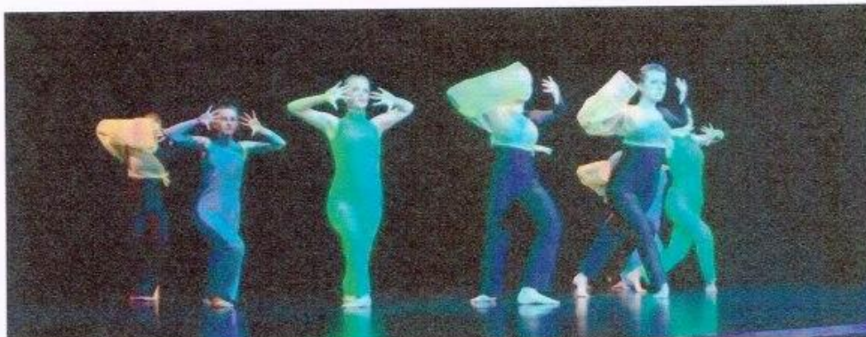
Pokaz prac dyplomowych Wydziału Rytmiki ZSM nr 1 Rzeszowie

16.04.2012 , aktualizacja: 17.04.2012 10:36 GAZETA WYBORCZA Rzeszów